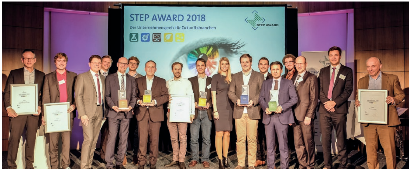
Bild: Preisträger 2018